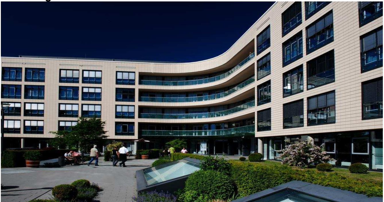
Abbildung: Das Klinikum Wolfsburg ist akademisches Lehrkrankenhaus der MHH. Es verfügt über 547 Betten in 20 Kliniken und Instituten und versorgt die Stadt Wolfsburg mit rund 125.000 Einwohnerinnen und Einwohnern sowie das dazugehörige Einzugsgebiet.

In dem nachfolgenden Qualitätsbericht stellen wir die wesentlichen Leistungsdaten und Kennzahlen unseres Klinikums des Jahres 2015 vor. Ziel des Qualitätsberichtes ist es, den Bürgerinnen und Bürgern im Vorfeld einer Krankenhausbehandlung eine Entscheidungs- und Orientierungshilfe zu geben. Die Krankenhäuser haben die Möglichkeit, ihre Leistungen nach Art, Anzahl und Qualität nach außen transparent und sichtbar darzustellen.